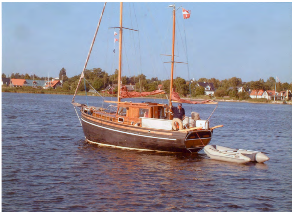
YATZY på fjorden

Medlemsblad for Frederiksværk Motorbådsklub Nr. 2 - 19. årg. Marts 2009