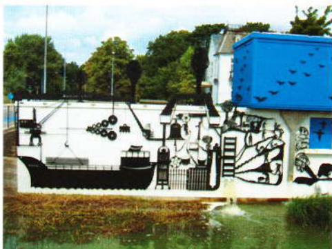
Højdepunktet for gåturen om søndagen var Frederiksværks nye udsmykning af pumpestationen.