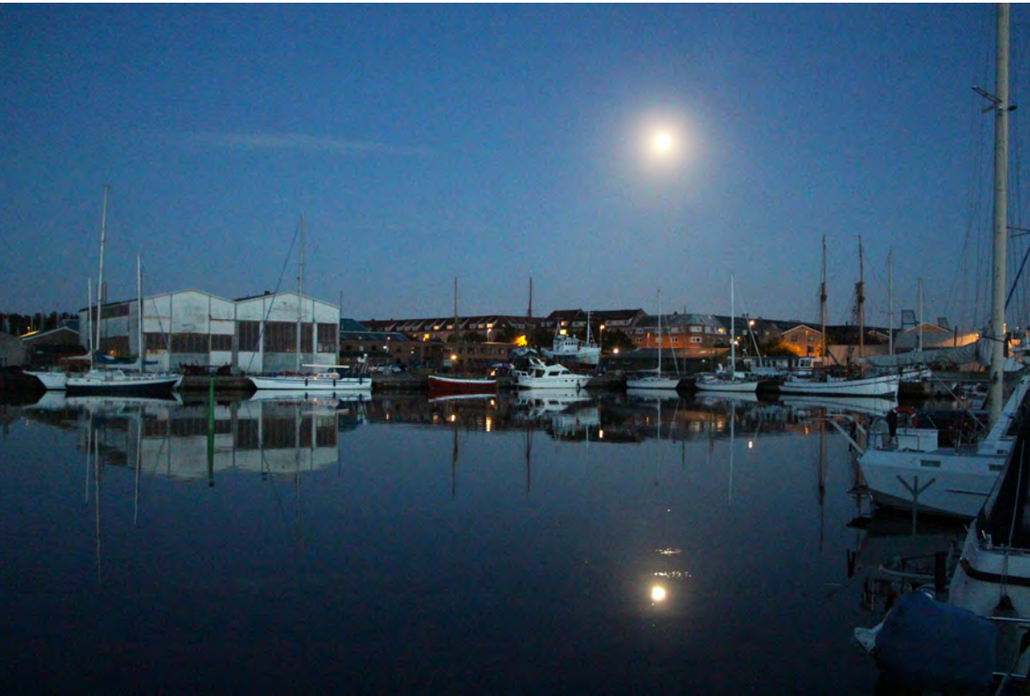
Aalborg by night

Medlemsblad for Frederiksværk Motorbådsklub Nr. 3 - 26. årg. Juni 2016