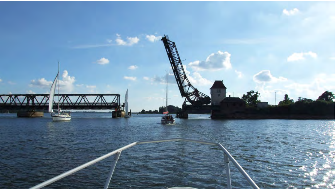
Jernbanebroen ved Lindaunis

Generalforsamling 12. februar 2017 kl. 9.00.