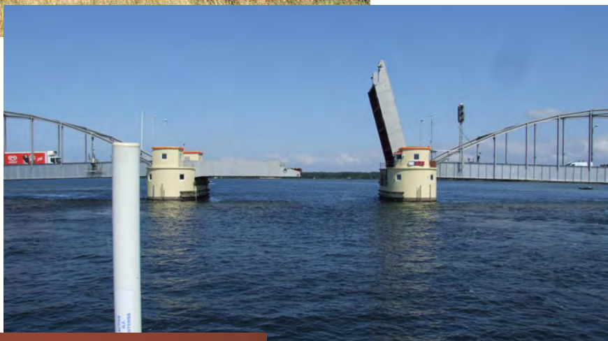
Passage Guldborg broen