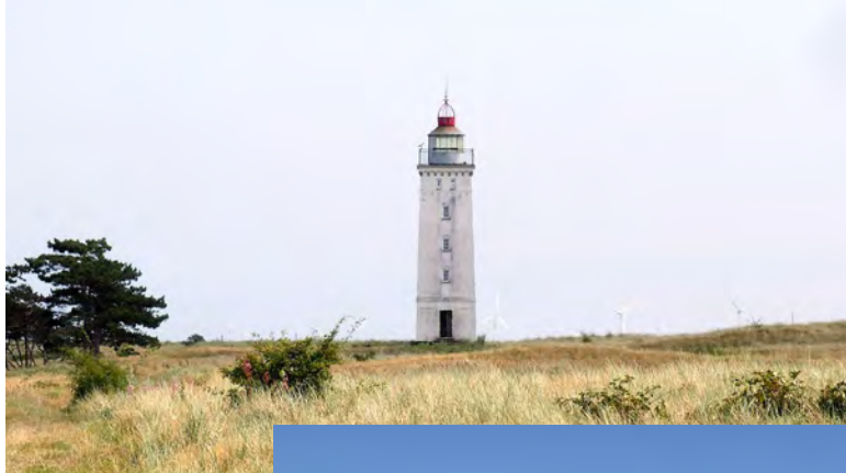
Hyllekrog Fyr